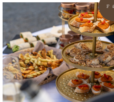
F & B